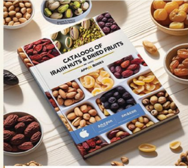
Nuts and legumes