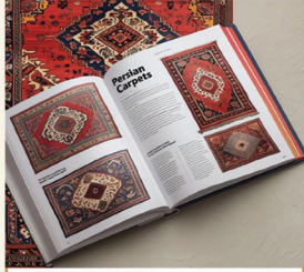
Carpets and kilims