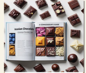
Chocolate and confectionery