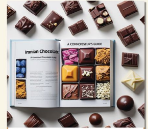
شکلات و شیرینی