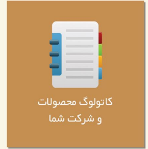
کاتالوگ محصولات و شرکت شما