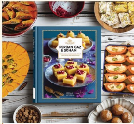
گاز و سوهان