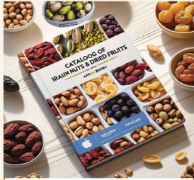
خشکبار و حیوانات