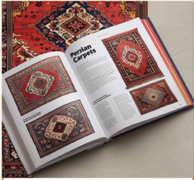
فرش و گلیم